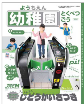
▼ 参加記念品の一例

参加記念品：先着 400 名さまには JR 東日本メカトロニクス(株)提供、小学館「幼稚園」特別号 (改札機工作キット付録付き)、それ以降は交通系 IC カードのキャラクターグッズや鉄道グッズなどから、お一人さまおひとつプレゼントします。