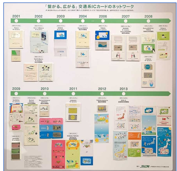
▲ 展示参考イメージ