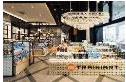
▲ TRAINIART (トレニアート) 店内