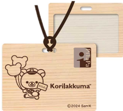
例：コリラックマ IC カードケース（当選グッズは他にもございます）

キャンペーンの詳細は、PiTaPa ホームページをご覧ください（キャンペーン特設サイトは 2024 年 12 月 16 日（月）10 時（予定）よりオープンいたします）。